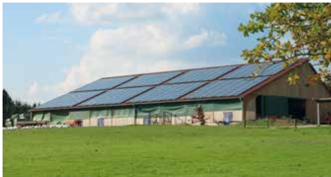
Eine mit Ruhrpower Grün + geförderte Photovoltaikanlage in Schwerte.

Der zur Versorgung der Ruhrpower Grün + -Kunden eingekaufte Strom stammt vollständig aus nachhaltigen Wasserkraftanlagen aus Norwegen.